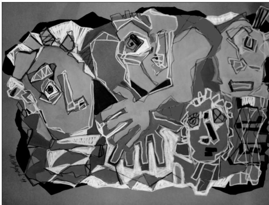
„Борба“ - Александра Маја Милошевиќ, комбинирани техники, дел од изложбата ЧОВЕК = ПРАВА, отворена на 16 декември, Музеј на Град Скопје, проект Решенија

Адеми потсети дека во политичката теоријата, во суштината на политичката култура се препознаваат три постулати: почитување, консензус и хомогеност по