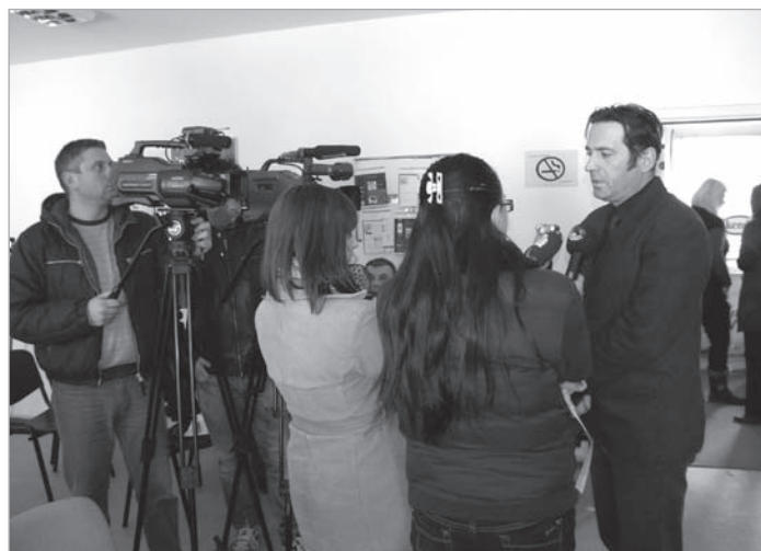
Политичка култура и дијалог во општините и влијание врз локалната заедница

Неретко во дискусиите беше споменувана и улогата на невладините организации во подигнувањето на нивото на политичка култура во општеството. Притоа, беа изнесени примери цивилниот сектор да биде функција, дури и во служба, на политичките центри на моќ. Иако негова примарна улога е опонирање на власта и корегирање на нејзините дејствија, во Македонија се случува спротивното. „Кај нас, најмалку 50 отсто од невладините организации имаат јавна или прикриена поддршка од Владата и се однесуваат како ограноци на владејачката партија“ укажа еден од учесниците на средбите. Потврда за тоа, додаде тој, е фактот што претседатели и членови на организации од цивилниот сектор, често завршуваат на партиските листи за пратеници или советници.