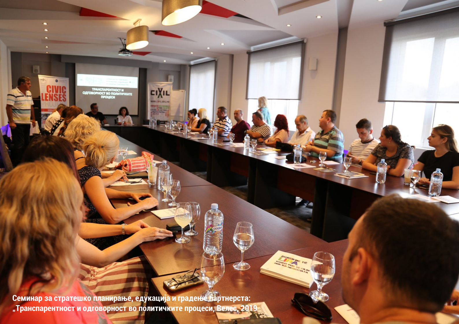
Семинар за стратешко планирање, едукација и градење партнерста: „Транспарентност и одговорност во политичките процеси, Велес, 2019