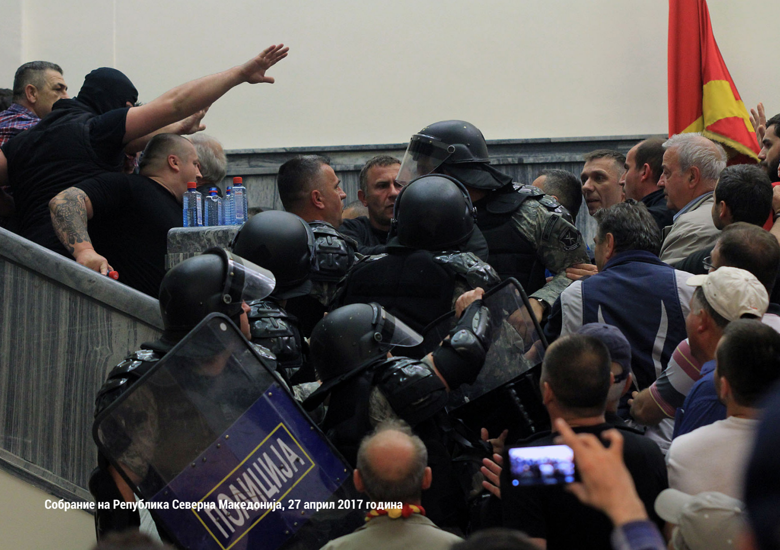
Собрание на Република Северна Македонија, 27 април 2017 година