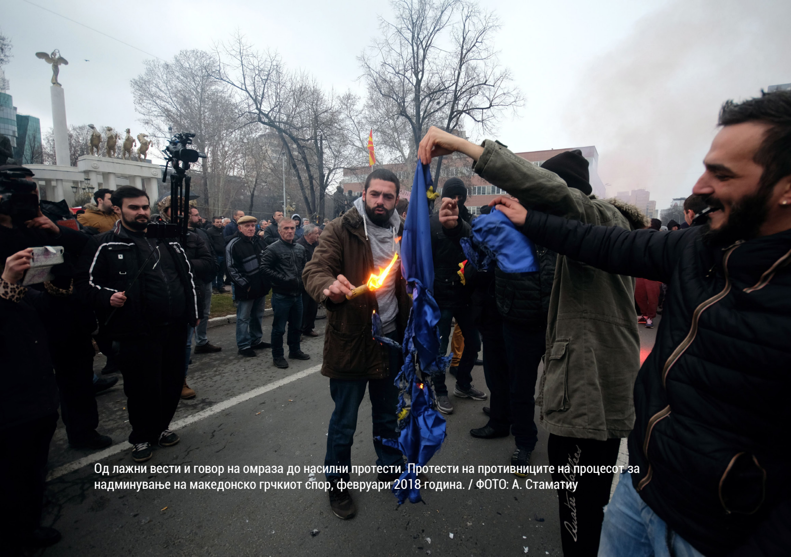
Од лажни вести и говор на омраза до насилни протести. Протести на противниците на процесот за надминување на македонско грчкиот спор, февруари 2018 година.