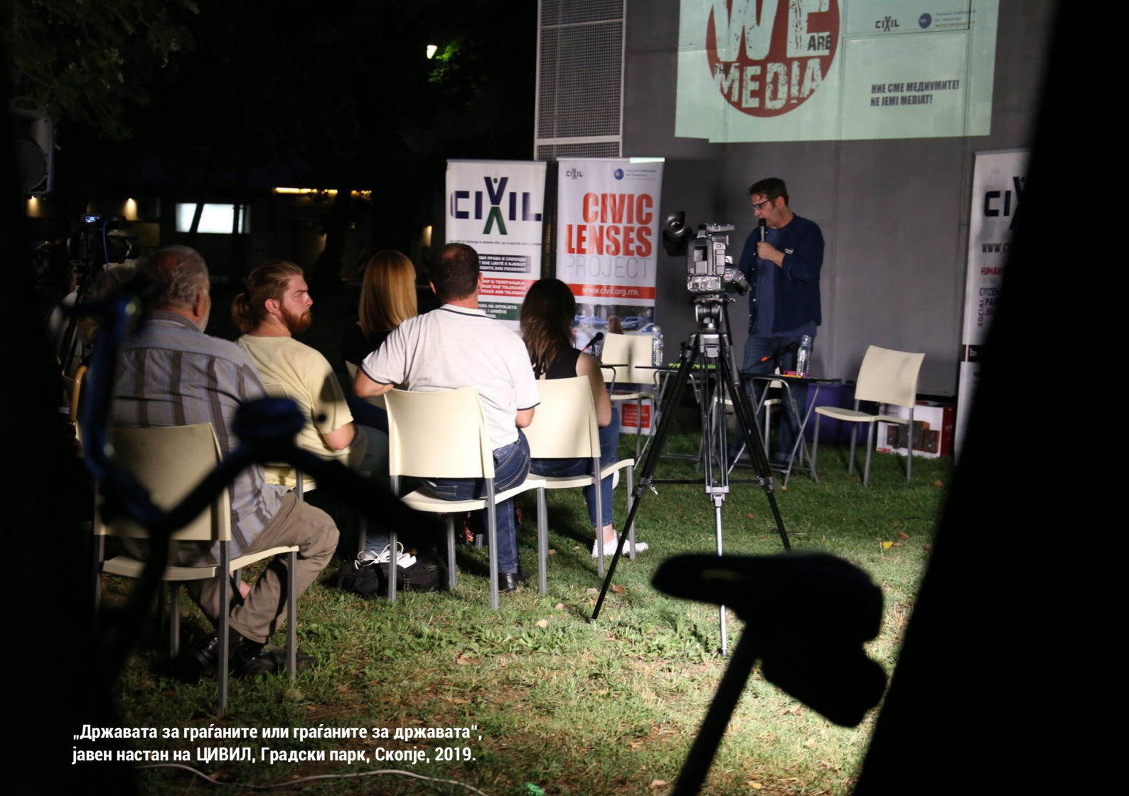
„Државата за граѓаните или граѓаните за државата“, јавен настан на ЦИВИЛ, Градски парк, Скопје, 2019.